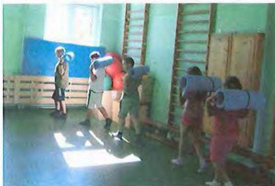
Wędrownka z karimatą przyjemnością bywa, gdy się ma świadomość, że uwypukla się klatka, a prostuje głowa, barki i szyja.